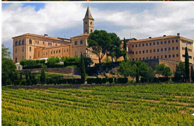
Le monastère des frères maristes de Les Avellanias, près de Balaguer.