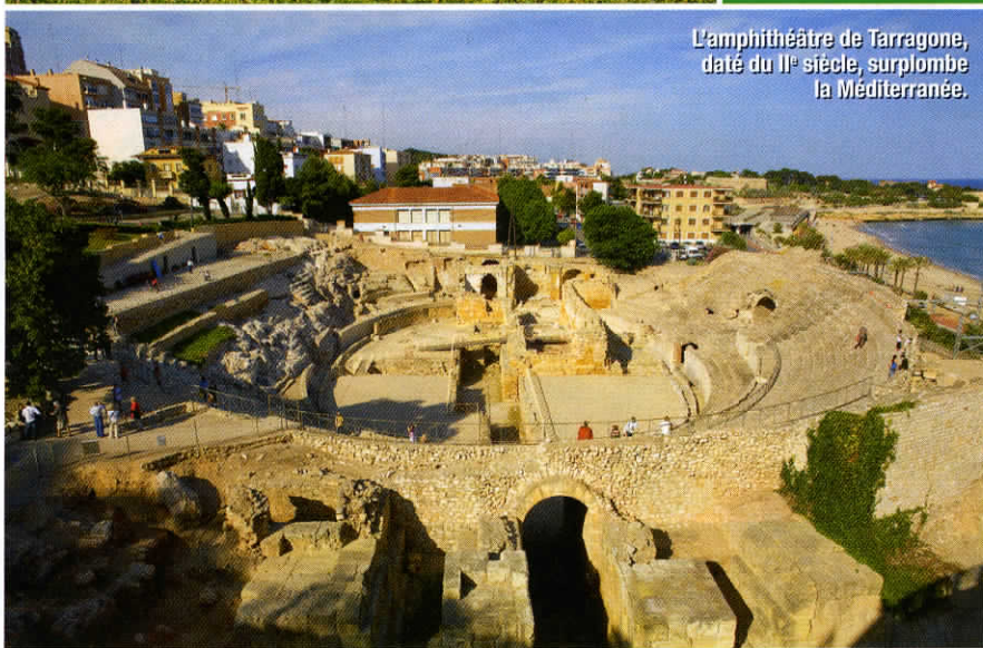
L'amphithéâtre de Tarragone, daté du II e siècle, surplombe la Méditerranée.