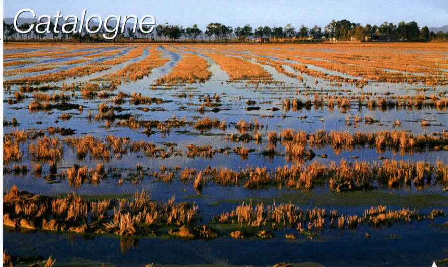
L'une des rizières du delta de l'Ebre. La région fournit 25 % de la production nationale espagnole.

Et si, pour tout un chacun, la Catalogne se résumait à Barcelone et la Costa Brava, cette province du nord-est de l'Espagne, comme nous l'avons constaté, abrite beaucoup d'autres centres d'intérêt. Le val d'Aran et ses montagnes, Lleida et ses lacs, le delta de l'Ebre et son écosystème. Ainsi que de magnifiques monastères, tel celui, étonnant de Montserrat. Le voyage s'impose !